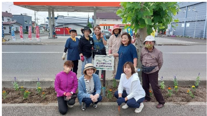
6月21日 国道38号植栽ボランティア