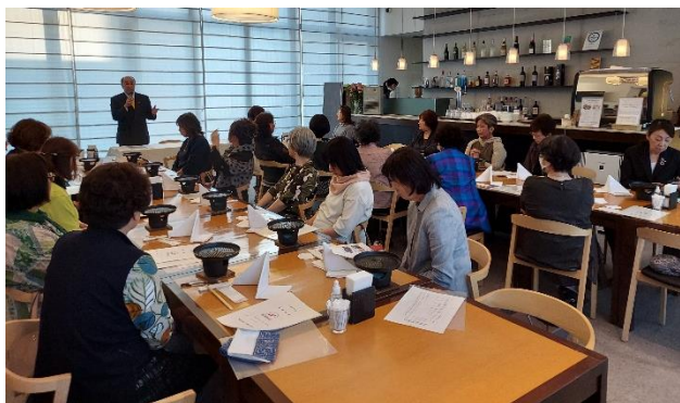
5月20日 令和6年度定時総会

この度、女性会に入会させていただきました。中学2年の時に「北の国から'92 巣立ち」を見て感銘を受け、大学進学を機に石川県から北海道に住み始め今年で27年目、すっかり道民です。皆さまにお会いしてお話できることを楽しみにしています。よろしくお願いいたします。