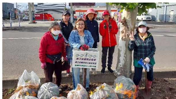
10月15日 植栽ボランティア（花抜き）