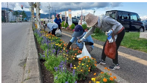
8月20日 植栽ボランティア（草抜き）

10歳と6歳双子の子育てに奮闘中、まだまだ未熟者の私ですが、 少しでも何かのお役に立てることができたら嬉しいです。 ご指導の程よろしくお願いいたします。