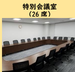
特別会議室 (26 席)