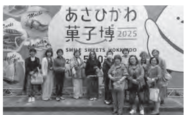
6月3日 あさひかわ菓子博視察見学会