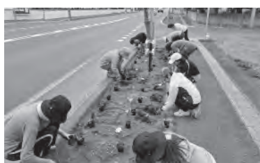
6月26日 国道38号植栽ボランティア