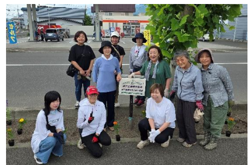
6月26日 植栽ボランティア(花植え)

発行日 FAX TEL 令和七年十月二十日 富良野商工会議所女性会 富良野市本町二番二十七号 富良野商工会議所内 〇一六七・二二・三五五 〇一六七・二二・三二二 〇一六七・二二・三二二